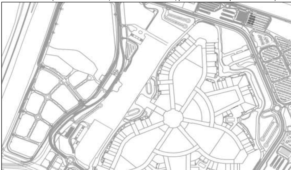
Planimetria del sito di EXPO 2020 Dubai