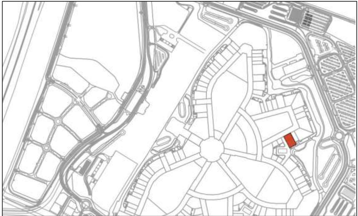
Ubicazione del lotto del Padiglione Italia nel sito espositivo di EXPO 2020 Dubai