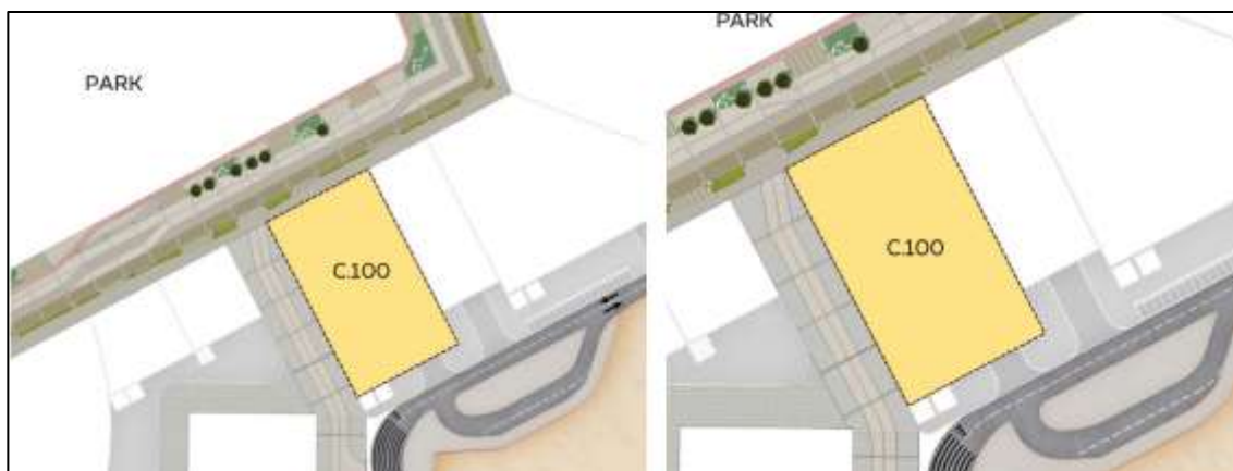
Pianta con identificazione del perimetro del Padiglione Italia e dell'affaccio sul North Park

Il lotto scelto per la realizzazione del Padiglione Italia ha una superficie totale di 3.420 mq. Le Linee guida dell'organizzazione permettono la realizzazione di un edificio con impronta a terra massima pari a 2.457 mq ed altezza massima di 27 metri, e una superficie lorda complessiva massima pari a 7.182 mq. La definizione sotto il profilo architettonico del Padiglione Italia è attualmente in corso, oggetto di un Concorso Internazionale di Progettazione i cui atti sono accessibili a tutti all'indirizzo https://gareappalti.invitalia.it .