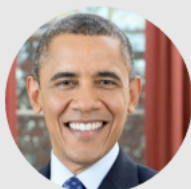
Barack H. Obama