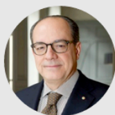
Paolo De Castro European Parliament First Vice President Committee on Agriculture and Rural Development